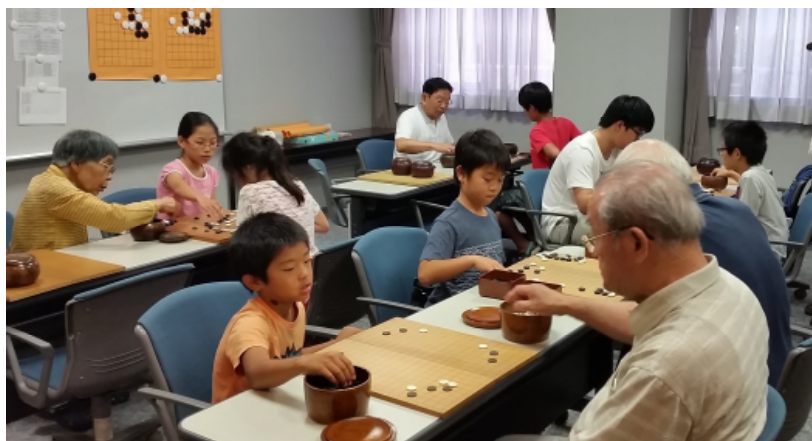
2年生から5年生まで、男の子も女の子も真剣です！

指導する皆さんにとっては「孫」のような児童の皆さんですが、長年の指導を通じて「どのお子さんも着実に成長していることが実感できます。囲碁を始めた頃よりも集中力が養われ、礼儀正しく対局できるように成長しました。」と深い愛情をもって指導にあたっていただいています。